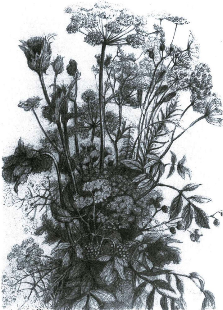
Otto Paetz „Feldblumenstrauß“ (Graphit & Kreide)